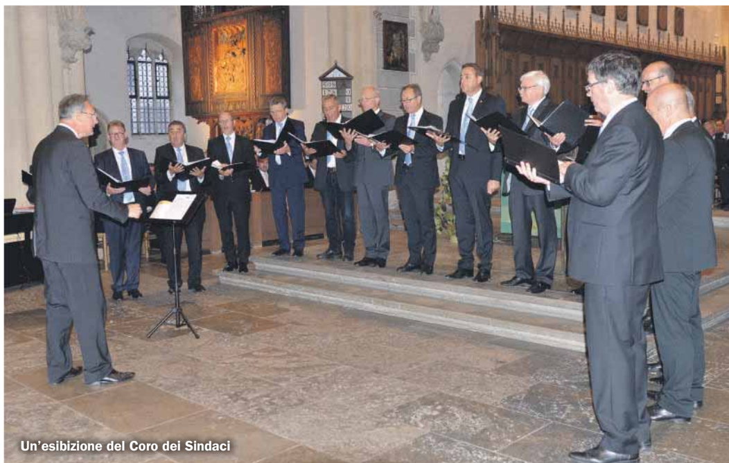
Un'esibizione del Coro dei Sindaci

Il coro non ha avuto una chiusura solenne, è andato sfaldandosi con il periodo della pandemia. Io non sono più sindaco e molti colleghi di quel gruppo neppure, però sarebbe bello se potesse riprendere.